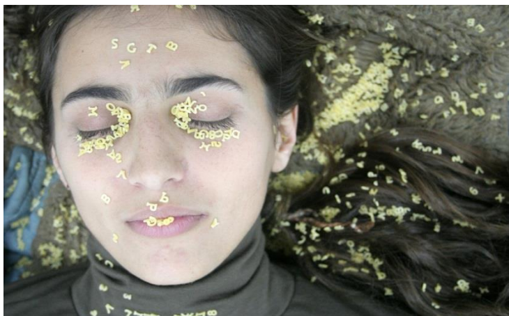
Figura 6 - Ambiente de Freezer - foto: Valentina Bolatti

Para encerrar esta abordagem, faz-se necessário pontuar que a abordagem e documentação dos trabalhos criados na América Latina aparecem cada vez mais nas diversas pesquisas acadêmicas, que por sinal é de extrema importância para a efetivação e valorização tanto da pesquisa acadêmica quanto artística, vemos cada vez mais as discussões proeminentes da cultura latina e, por assim, permite a possibilidade de se criar outras e inimagináveis histórias das artes, pois ainda há pouca literatura no assunto.