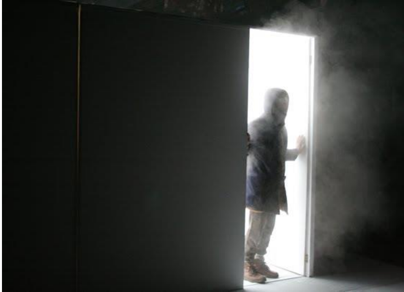
Figura 2 - Entrada de Freezer

A metáfora utilizada está sobre uma máquina fictícia, teoricamente térmica, que funciona em um ciclo reversível ideal e se mostra mais eficiente do que as máquinas reais, já que estas estão sujeitas a dificuldades práticas, enquanto a primeira age por meio da imaginação diretamente no subjetivo do público.