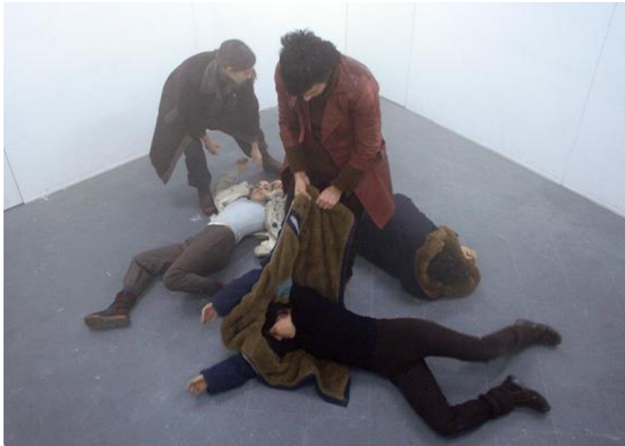
Figura 3 - Ambiente de Freezer - foto: Valentina Bolatti