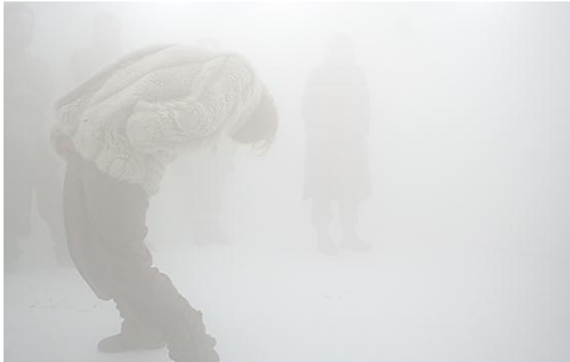
Figura 5 - Ambiente de Freezer

A edificação não é configurada como estrutura fixa e delimitada, mas está inerente ao próprio caminhar, em que a cada passo se é possível viver experiências únicas e, cada participante, sendo somente uma parte do próprio caminhar da obra, tem possibilidade de sair e retornar. Habitar é um acontecimento em constante mutação, que obviamente é pressuposto por uma técnica para que se materialize. Cabe ao caminhante gerir a imagem ímpar que